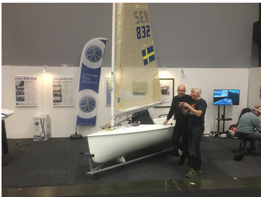
En Finnjolle är utställd i Västkustens Seglarförbunds monter under Båtmässan i Göteborg 3 – 11 februari 2024.