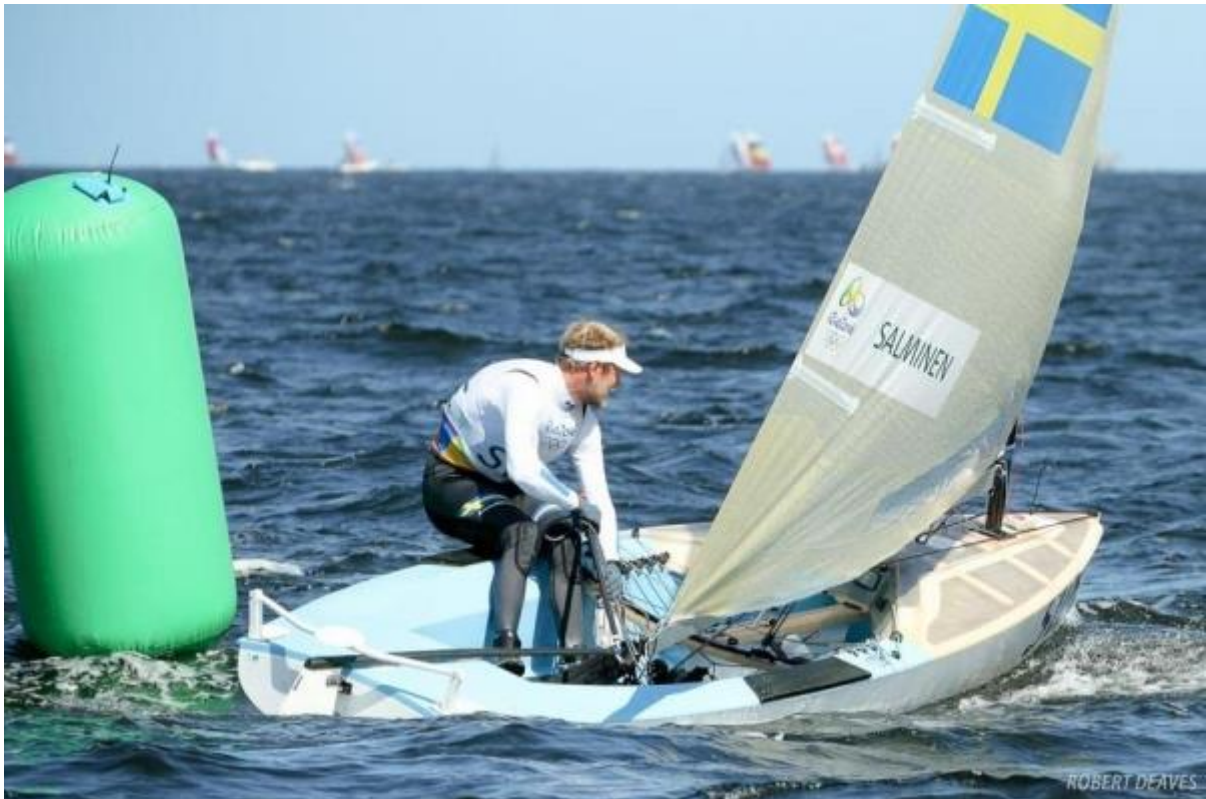
Här har vi en bild från OS-seglingarna i Rio de Janeiro 2016... Max rundar upp för kryss.